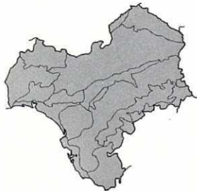
Frecuente en todo el territorio. Distribución general. W y S de Europa, NW de África, SW de Asia, Macaronesia.

3. Torilis leptophylla (L.) Reichenb. fil. in Reichenb. & Reichenb. fil., Icon. Fl. Germ. 21: 83, t. 169 (1866)