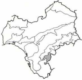
Sobre calizas. Grazales. Distribución general. Región Mediterránea.

c. subsp. elongata (Hoffmanns. & Link) Cannon, Feddes Reperit. 79: 62 (1968)