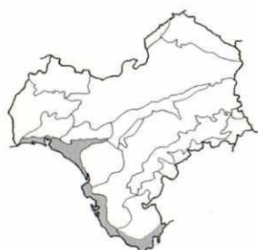
Arenales marítimos. Litoral, Algeciras. Distribución general. Costas del Atlántico, desde Islandia hasta Canarias (Lanzarote y Gran Canaria), y del Mediterráneo.

Hierbas perennes, blanco-aracnoideas, caulescentes. Capítulos reunidos en inflorescencia corimbosa. Involucro con varias filas de brácteas. Receptáculo ligeramente cónico, con brácteas interseminales. Capítulos discoideos y homógamos, con flores flosculosas hermafroditas. Flores flosculosas con base desigualmente decurrente, cubriendo parcialmente al ovario. Aquenios con 3-4 costillas longitudinales. Vilano ausente.