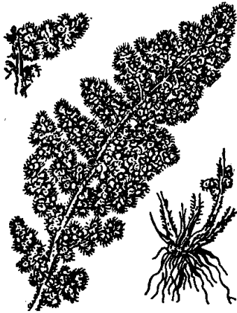
FIG. 36. — Notholaena vellea .

forma cheilanthoides Trabut in J. et M. Cat. Maroc, p. 917. — Limbe court, largement lancéolé, à pinnules petites très vertes et glabrescentes à la face supérieure. Port de Cheilanthus pteridioides .